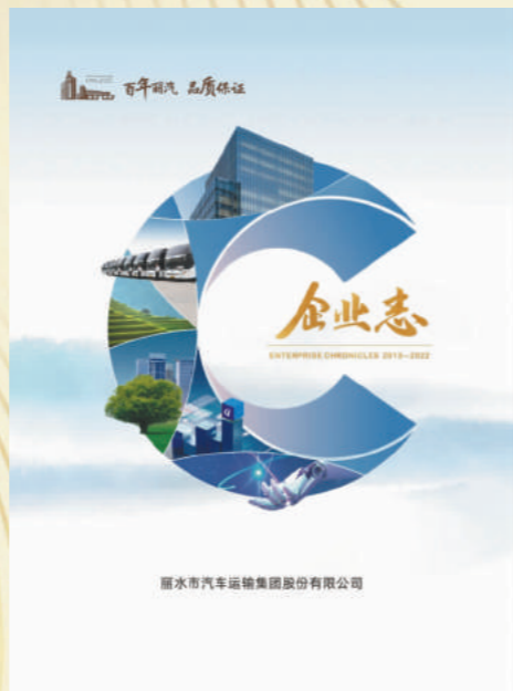
企业志、画册编纂:2月1日至10月20日,开展公司第四部志书和画册的编纂工作,用文字记叙过去10年间公司的发展变化,用图片浓缩过去10年间公司的光辉历程。