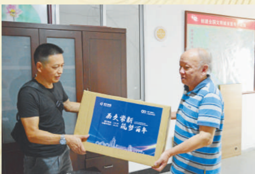
退休工人纪念品发放:从9月4日开始,集团公司为804名退休职工发放纪念品。

“我和丽汽”征文和“员工说”短视频比赛,2月初到9月30日,围绕“历久常新 筑梦百年”主旋律,结合企业史,真实反映丽汽90年来的发展变革和成就。