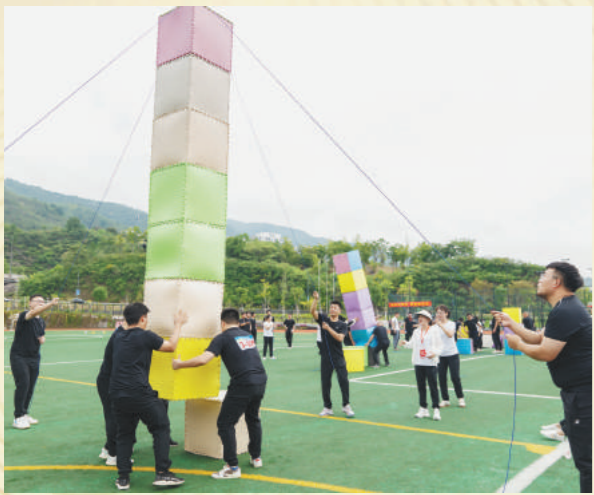
职工运动会:9月7日到9月23日,在取高召开第十届职工运动会。共有8支代表队,638名运动员参赛。