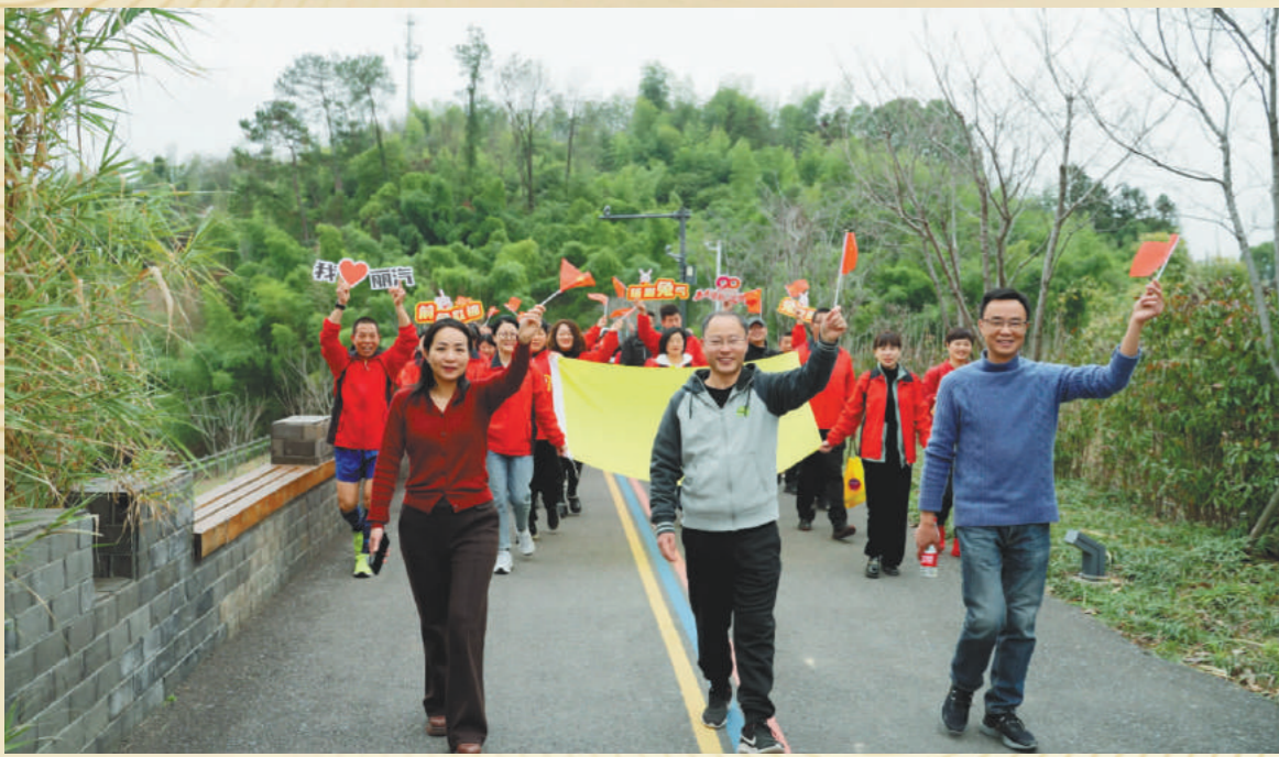
90日健步走:从2月1日起至5月1日,共计90天,员工通过手机App记录,每次健步需在1小时内健走3公里。

在建司90周年这一重要时间节点和里程碑,集团公司本着全面展示的原则,开展了以“历久常新 筑梦百年”为主题的系列庆祝活动,烘托了建司九十周年的喜庆热烈氛围。各类活动各有侧重、各具特色,充分展示了丽汽员工积极向上的精神风貌,既是对集团过往工作业绩的展示和表达,也是对未来进一步发展的祝愿和期许。让我们一起重温那些活动的精彩瞬间!