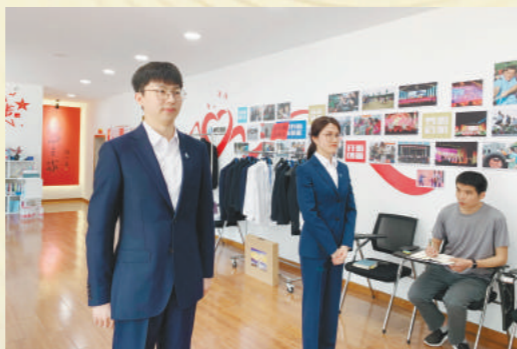
司服定制:为全体700余名在在岗员工统一定制九十周年司服,于9月上旬发放。