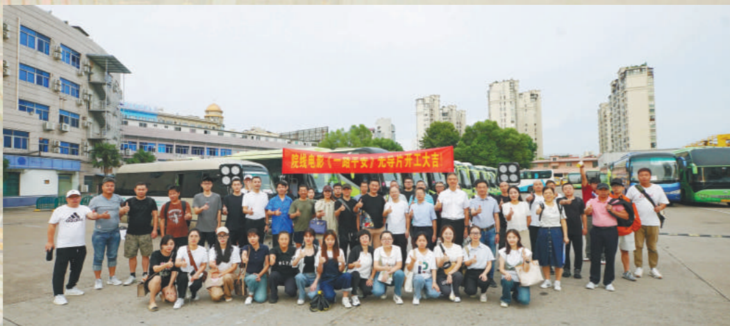
微电影拍摄:拍摄九十周年微电影《一路平安》,从年初开始策划,9月13日正式开机,10月底完成成片。