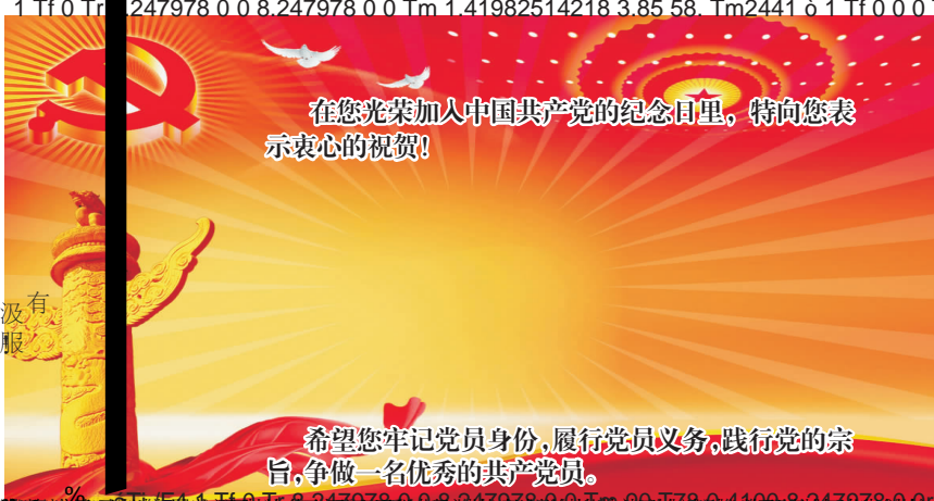
在您光荣加入中国共产党的纪念日子里,特向您表示衷心的祝贺!希望您牢记党员身份,履行党员义务,践行党的宗旨,争做一名优秀的共产党员。